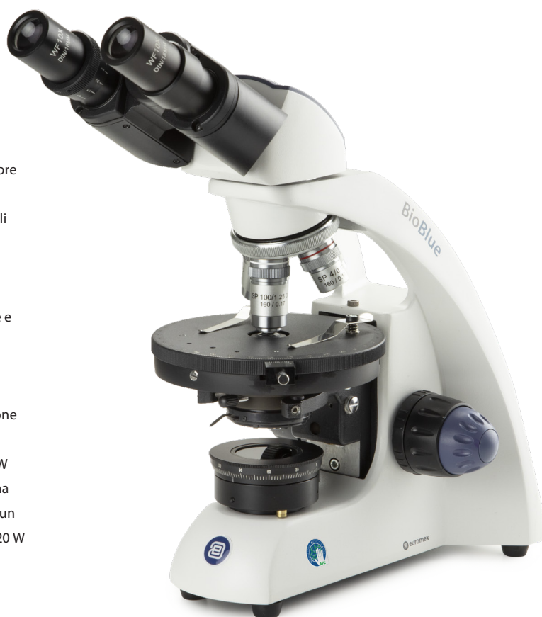
● Modello di polarizzazione BB.4260-P-HLED

APL (Anti-bacterial Protection Layer) è un rivoluzionario trattamento della vernice applicato alle parti più critiche dei nostri prodotti. Un microscopio con APL limiterà la crescita di microrganismi, tra cui batteri e muffe