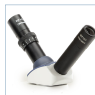
Testata di discussione