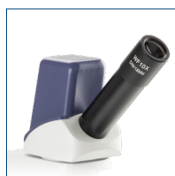
Testata monocolare digitale