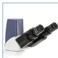
Testata binocolare digitale