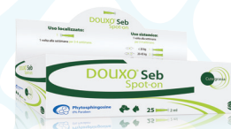
SPOT-ON 25X2 ml