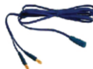
Cavo bipolare (3 mt.)