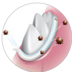
Con la protezione